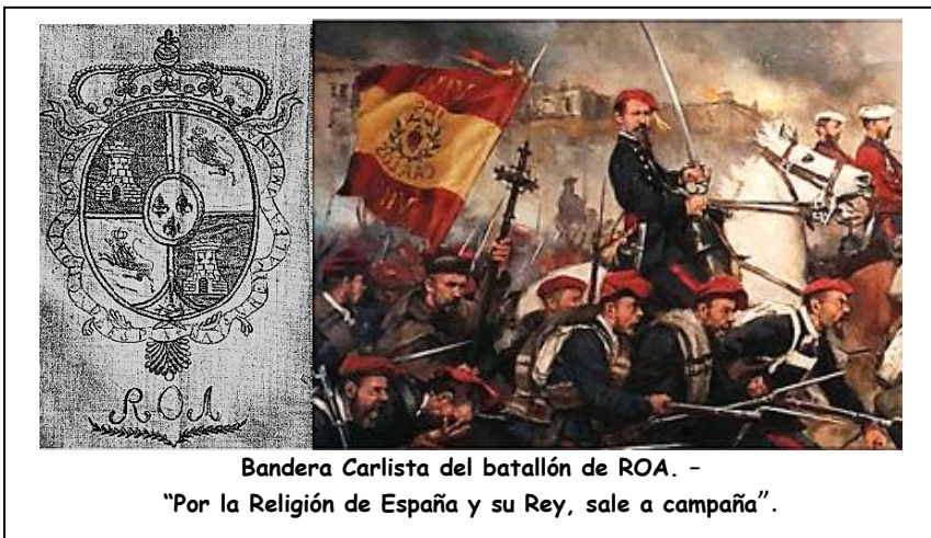
Bandera Carlista del batallón de ROA. - "Por la Religión de España y su Rey, sale a campaña".

Al amanecer del día 30 de abril de 1835, el carlista Jerónimo Merino, se presenta en Roa con 1000 hombres, pero es rechazado por los urbanos, desahogando su rabia de ver frustrado su proyecto, incendia casas y la iglesia parroquial. 37